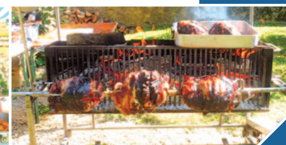
Les dirigeants du club ont tenu le stand restauration. Les jambons à la broche ont régalé les randonneurs.