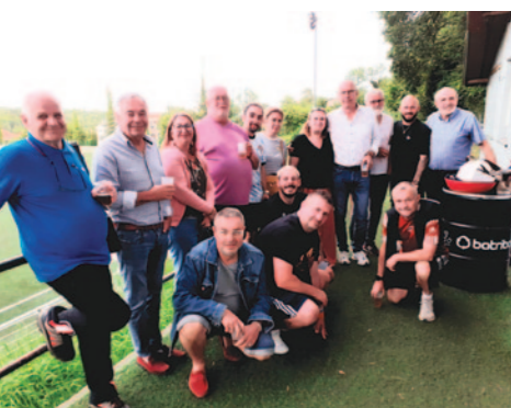
Une partie des participants à l'assemblée générale.